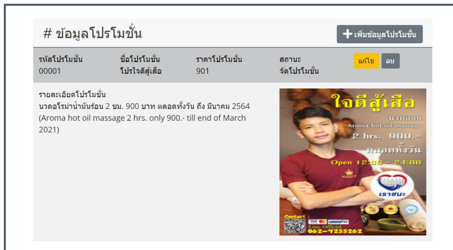
ภาพที่ 4.11 ข้อมูลโปรโมชั่น

จากภาพที่ 4.10 แสดงข้อมูลเงินรายได้ของร้านโดยแสดงเป็นเดือนสามารถคำนวณค่าใช้จ่ายภายในร้านได้