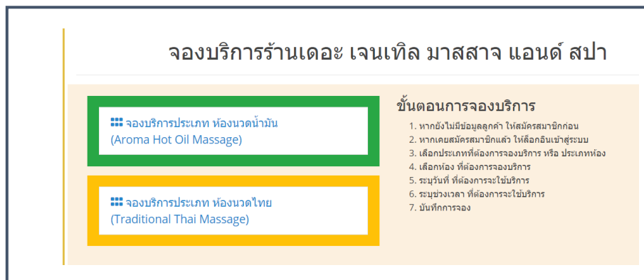
ภาพที่ 4.20 หน้าการจองบริการ

จากภาพที่ 4.20 แสดงขั้นตอนการจองบริการและเลือกประเภทที่จะใช้บริการ