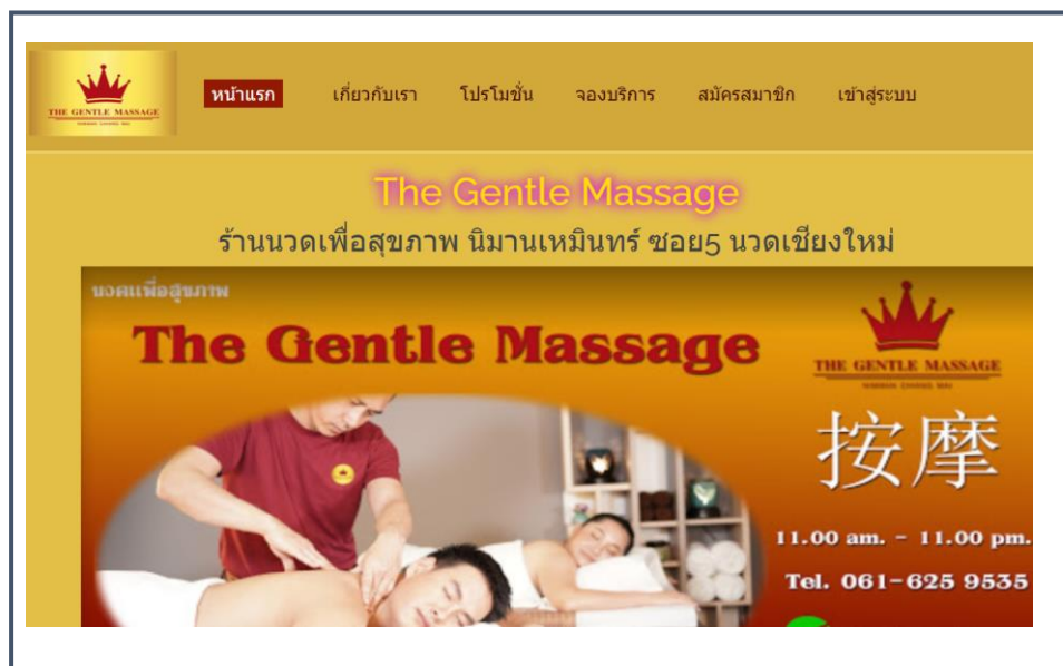
ภาพที่ 4.1 หน้าแรก

จากภาพที่ 4.1 เป็นหน้าแรกที่ทุกคนที่เข้าเว็บไซต์มาจะมาเจอหน้าหลักที่จะมีข้อมูลเบื้องต้นร้าน รูปแบบการให้บริการ ซึ่งจะมีเมนูที่จะนำทางให้ผู้ใช้ เข้าสู่หน้าต่าง ๆ เช่นเกี่ยวกับเรา, โปรโมชั่น, การจอง ซึ่งจะเป็นระบบส่วนต่าง ๆ ของร้าน